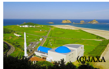
世界一美しいロケット発射場 「種子島宇宙センター」