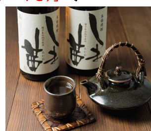
種子島の本格焼酎

※写真はイメージ画像です。この他にも、種子島西之表市ならではの特産品が充実の品揃えです！